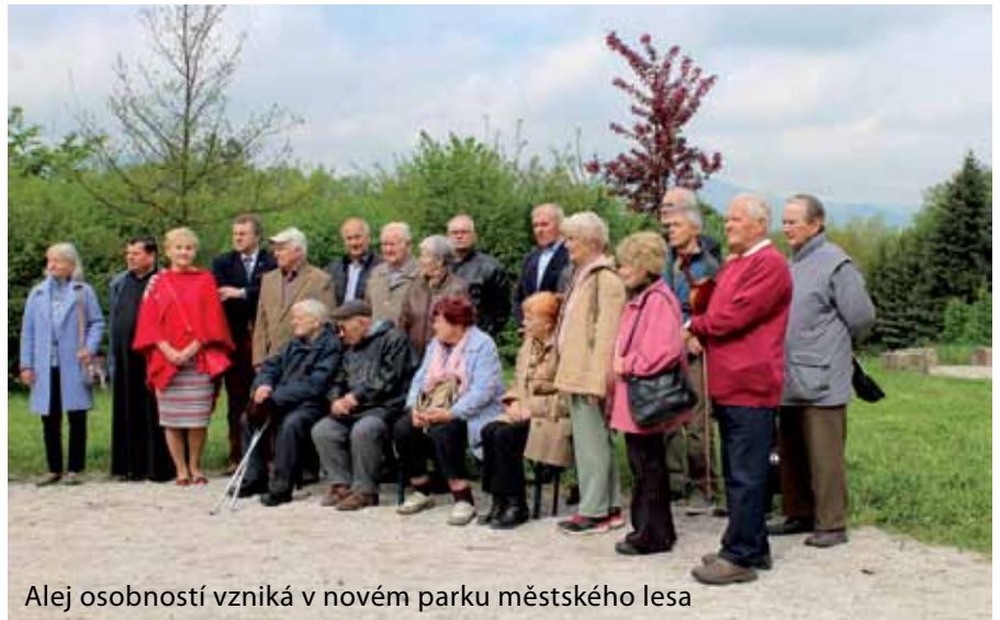
Alej osobností vzniká v novém parku městského lesa

V květnu proběhly dvě akce, které z pohledu nás organizátorů patří k těm nejmilejším. První bylo vítání nových jablunkovských občánků,