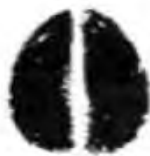
Srna (4 cm)