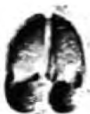
Jelen (9 cm)