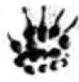
Jezevec (5-7 cm)