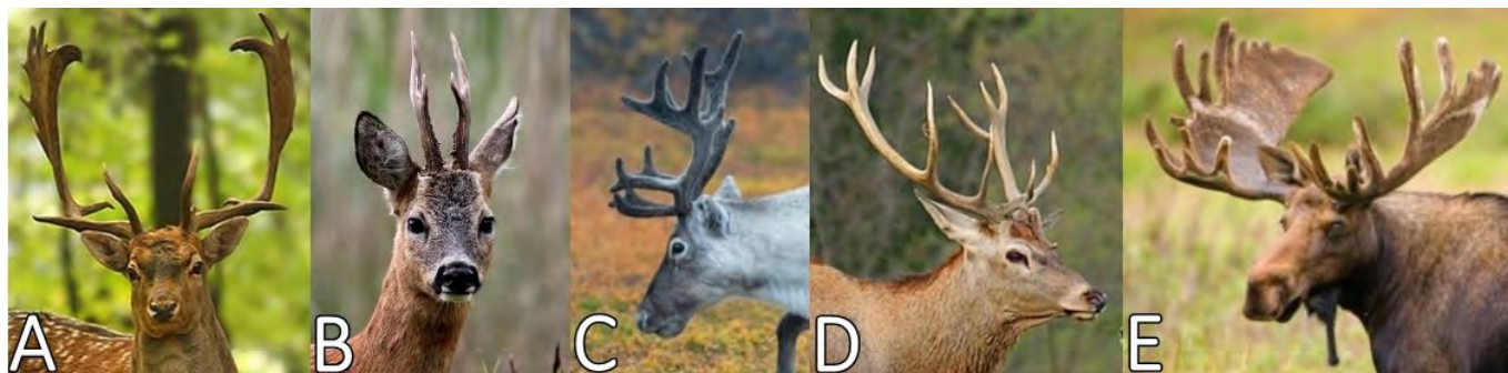
A – daněk evropský, B – srnec obecný, C – srnec polární, D – jelen evropský, E – los evropský