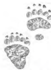
Medvěd (až 20 cm)