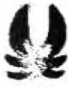
Kanec (8 cm)