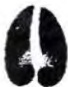
Srniec (5 cm)